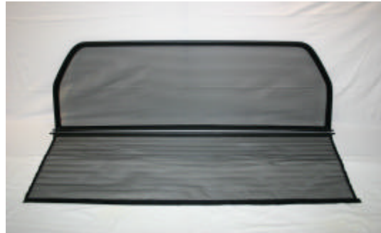
rechte Seite in Fahrtrichtung